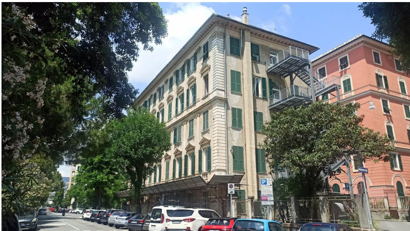
Immagine del prospetto sud