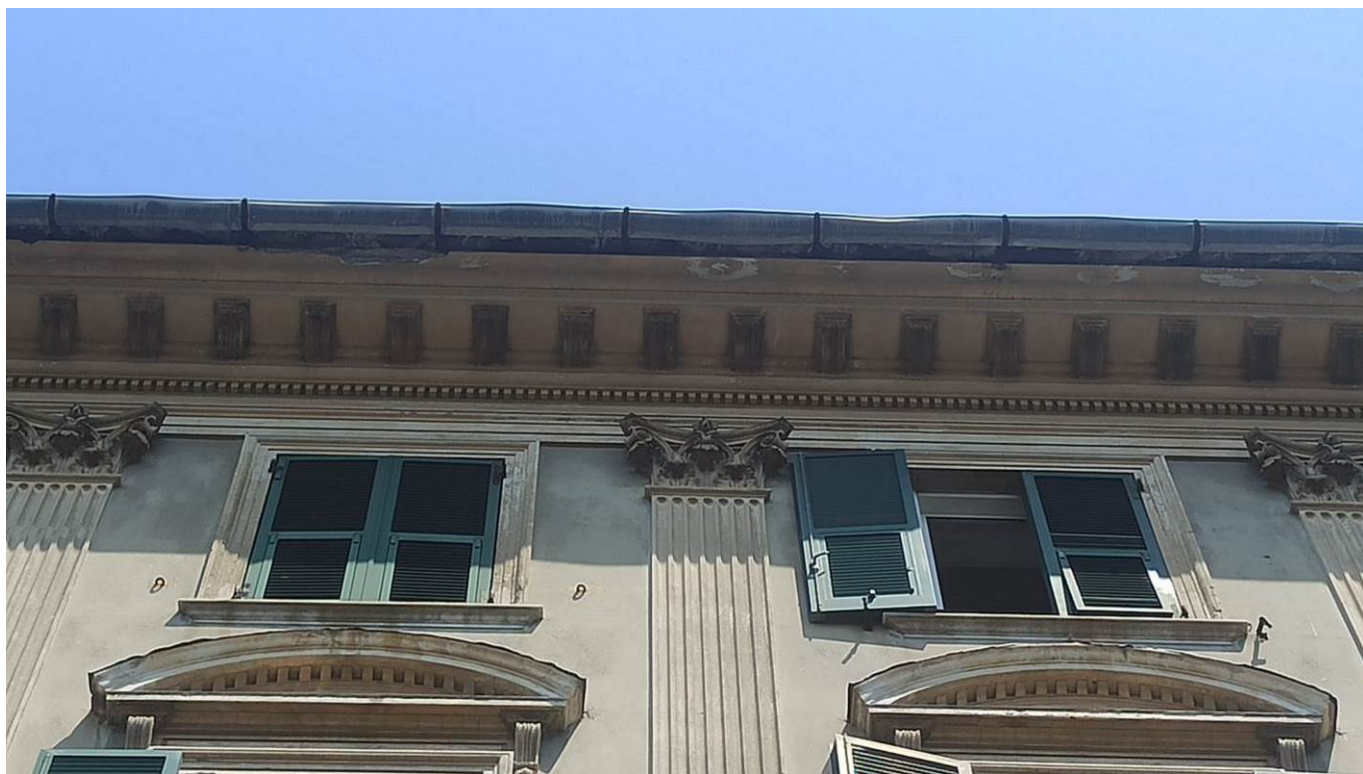
Particolare del cornicione del prospetto ovest