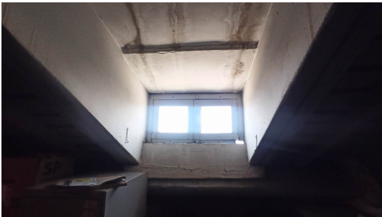
Particolare del serramento da sostituire