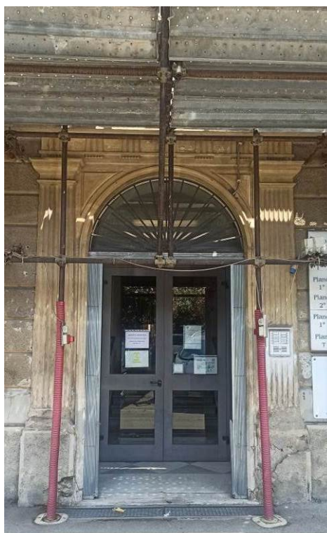
Particolare del portone d'ingresso al Padiglione E