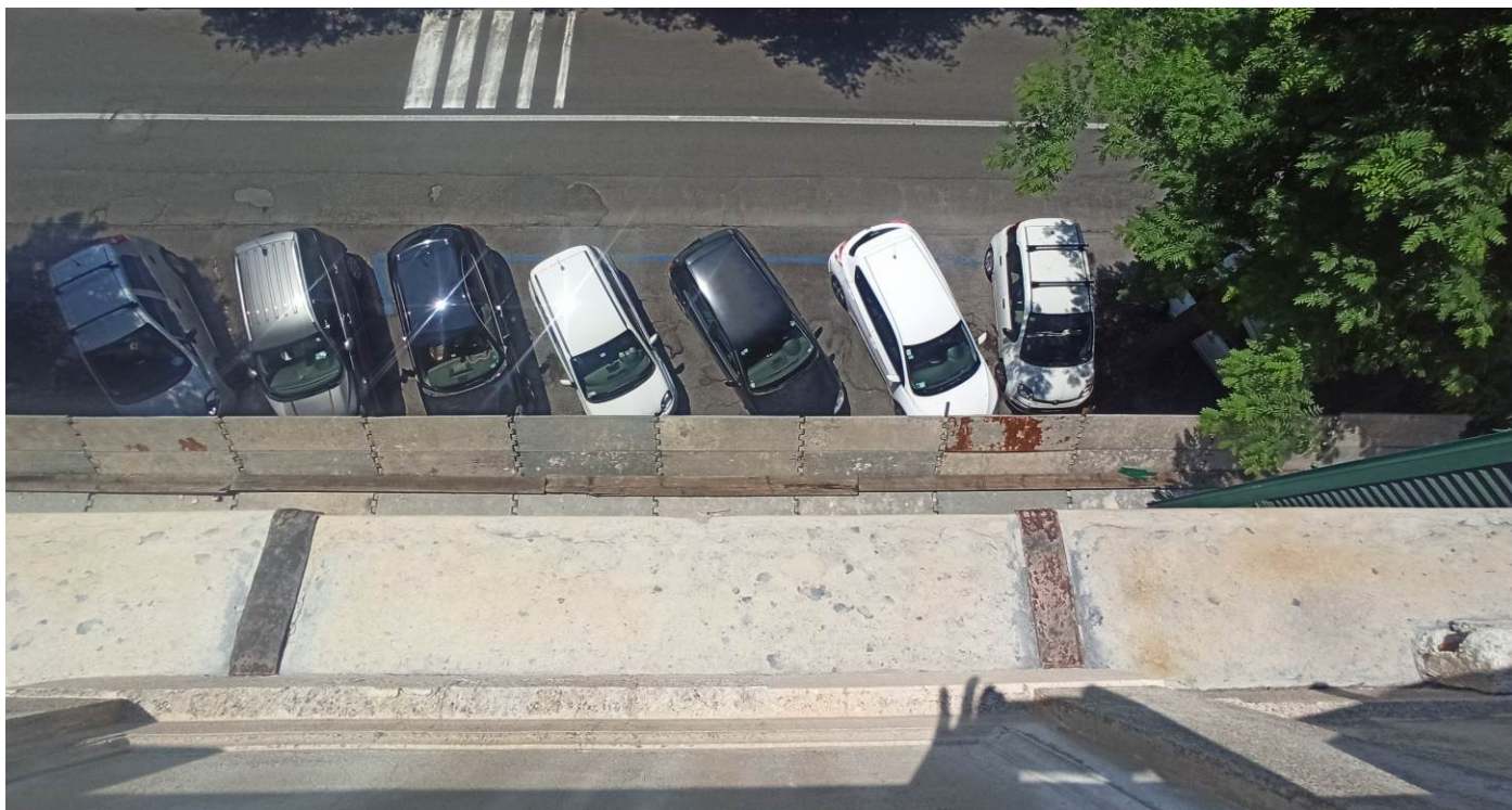
Vista dall'alto di una delle due cornici marcapiano aggettanti dell'edificio