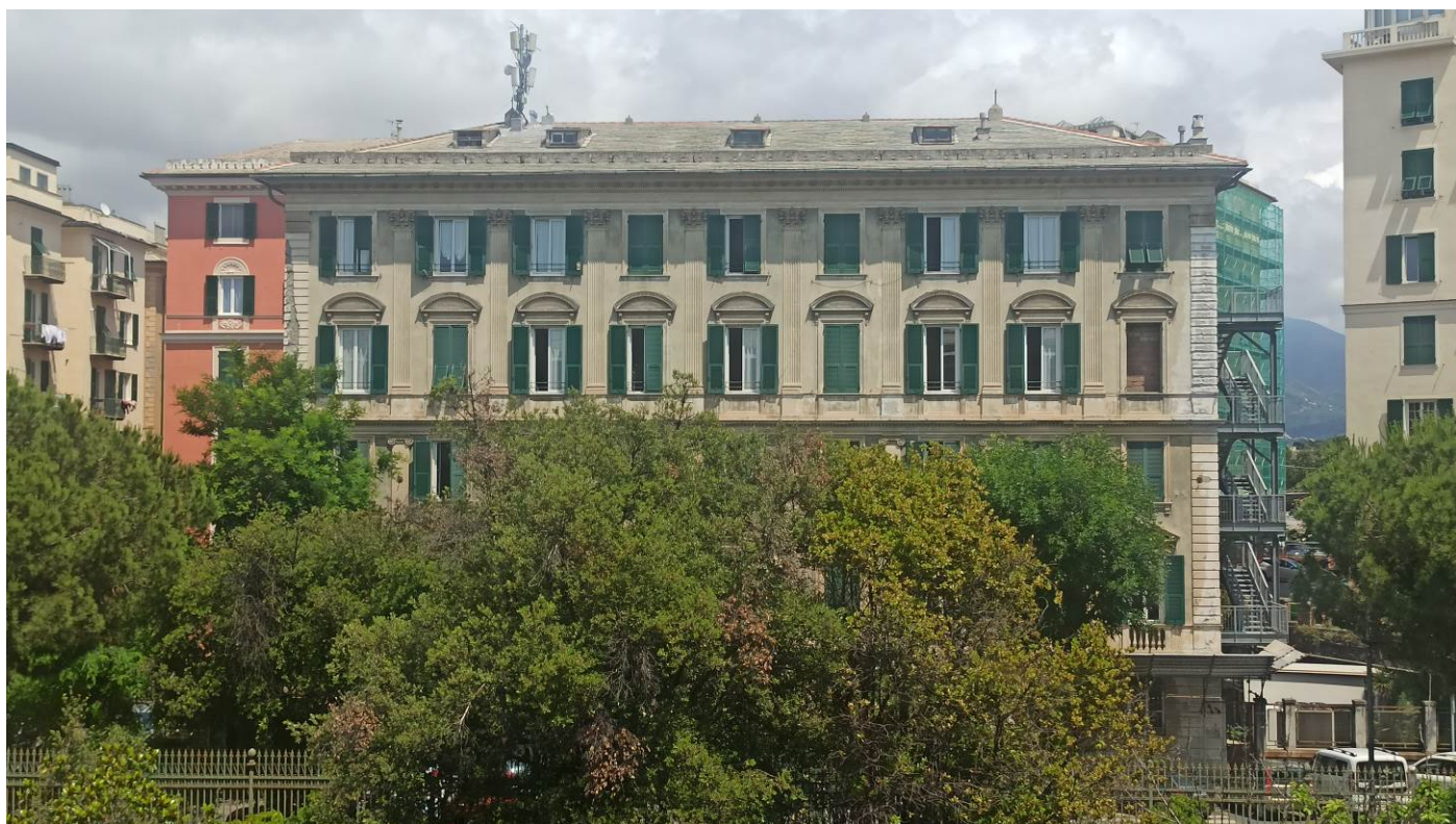
Prospetto ovest su via Volta