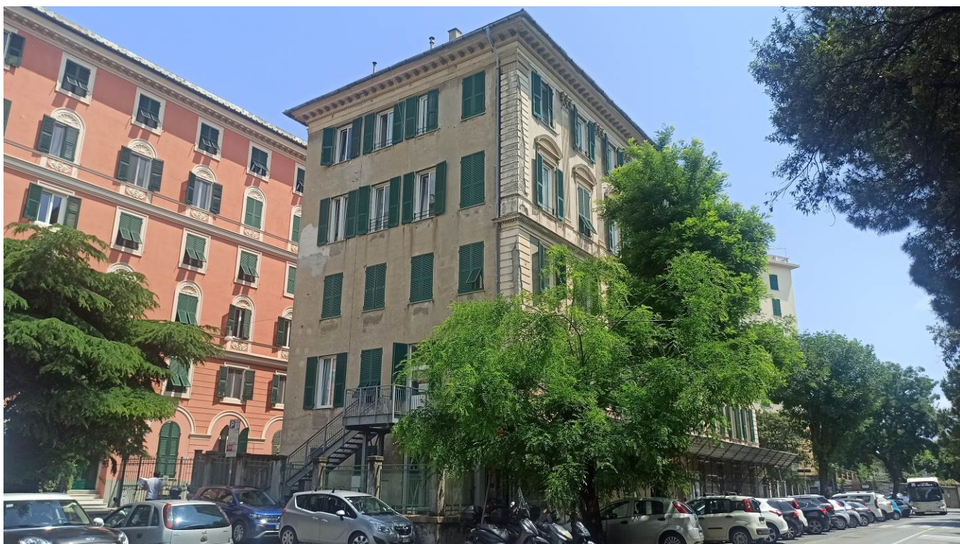
Immagine del prospetto nord