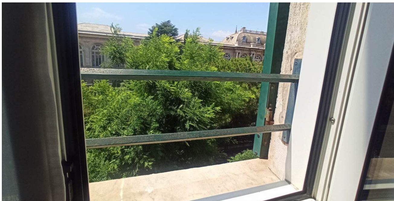
Immagine del parapetto metallico posto a protezione delle bucature dei vari piani