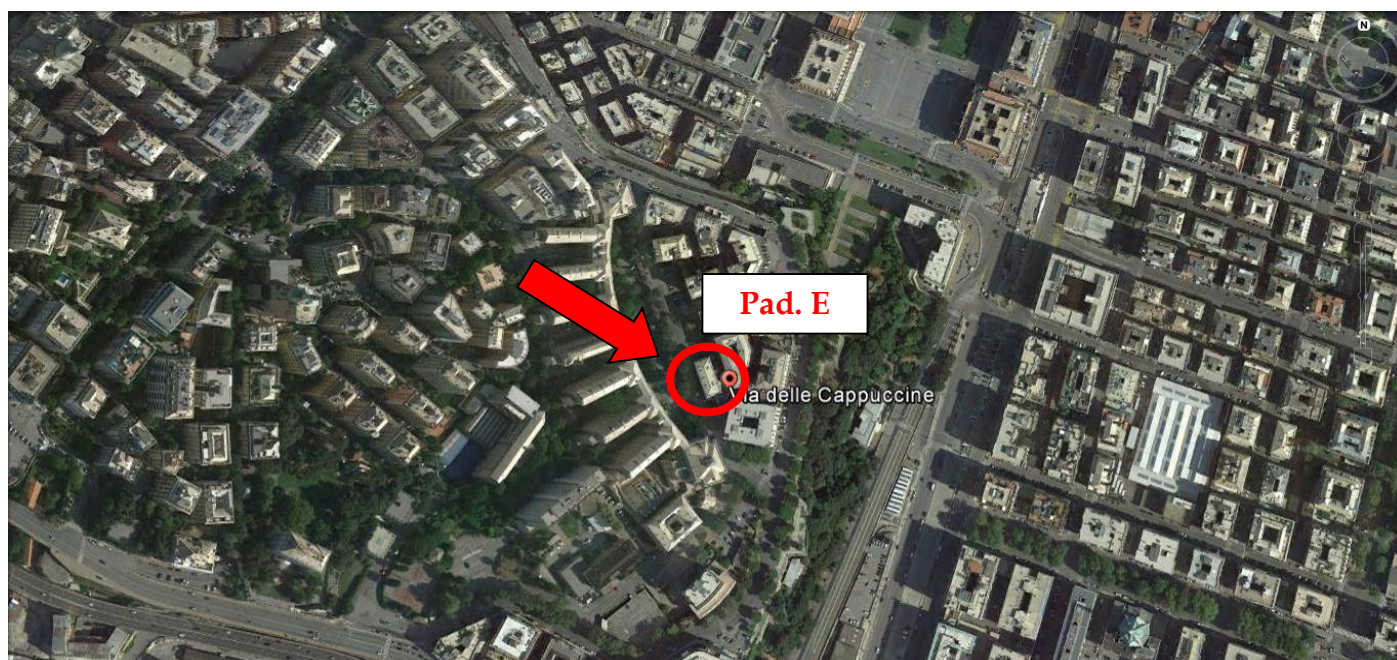
Immagine dal satellite dell'edificio oggetto di intervento