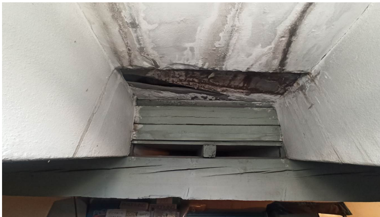
Particolare della copertura del sottotetto oggetto di intervento