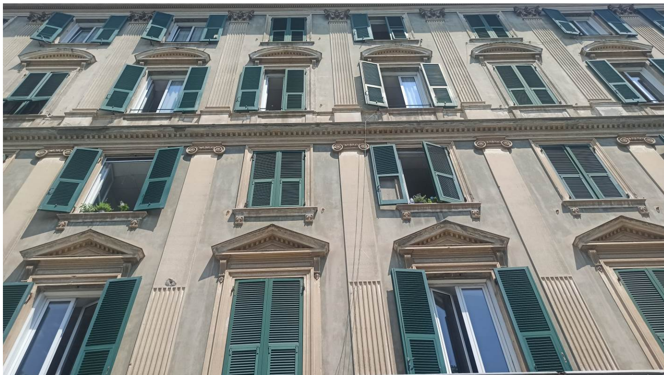
Particolare del prospetto ovest