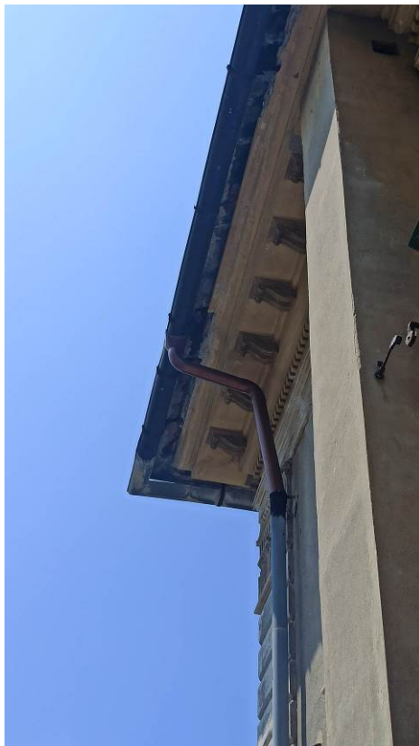
Particolare della lattoneria di cui è prevista la sostituzione